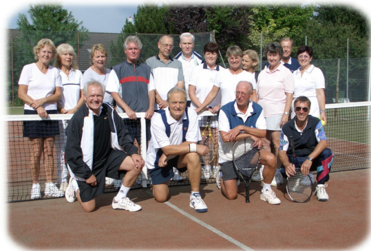
Die Teilnehmer des Freundschaftsspiels

Damit wir alle Mitglieder ganz aktuell informieren können, bitten wir nochmals, ihre aktuelle eMail Adresse an vorstand@tc-neu-anspach.de zu melden. Auch die Info erhalten Sie-falls nicht anders erwünscht- als eMail. Das hat z.B. den Vorteil, dass Sie die Bilder in Farbe bekommen und sie bei Interesse in ihrem PC speichern können.