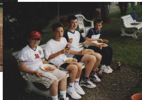
Pasta-Pause bei der Tennisfreizeit