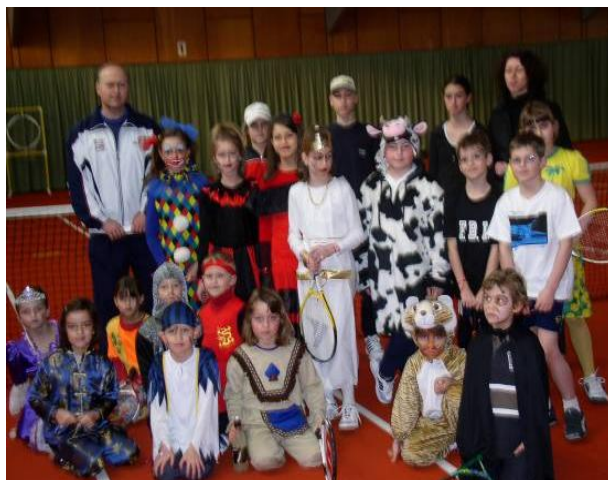
Phantasievolle Kostüme und jede Menge Spaß...