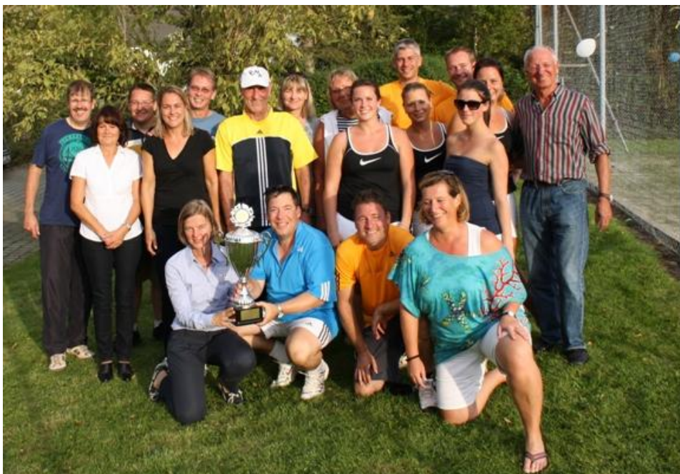
So strahlen Sieger: Unsere erfolgreiche Triple-Trophy-Mannschaft 2011